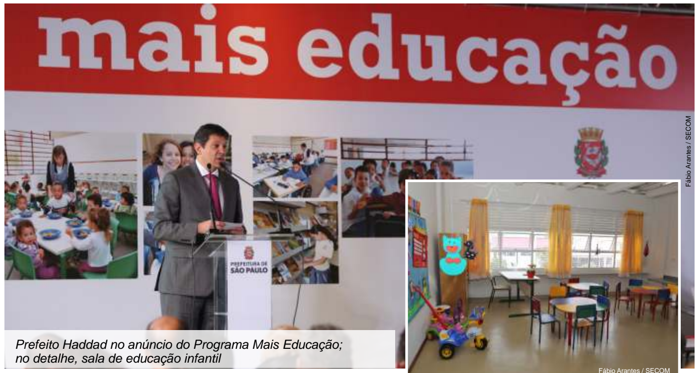
Prefeito Haddad no anúncio do Programa Mais Educação; no detalhe, sala de educação infantil

O programa inclui a ampliação da jornada escolar para alunos da rede municipal, com oferta de aulas de reforço, atividades culturais e esportivas. Já são 232 escolas inscritas, com mais de 73 mil alunos beneficiados.