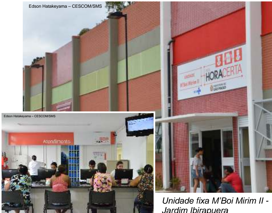
Unidade fixa M'Boi Mirim II - Jardim Ibirapuera

As unidades fixas, que realizavam juntas 15,6 mil consultas por mês, passaram a fazer, em média, 23,5 mil atendimentos com a ampliação dos serviços, além de