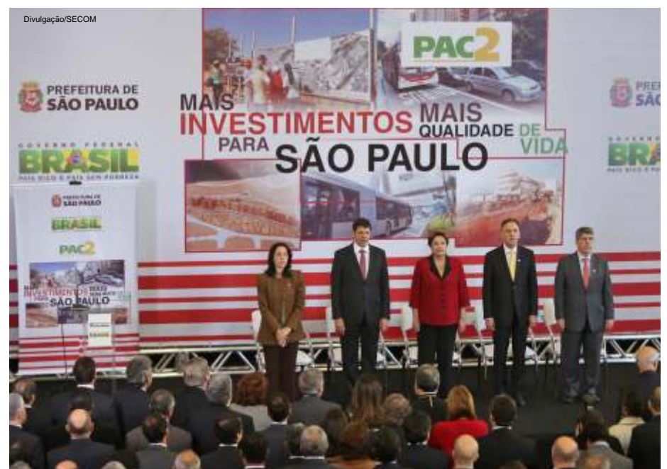
Presidenta Dilma Rousseff anuncia investimentos do PAC2 em São Paulo

A Prefeitura entregou 1.940 moradias e possui 27 mil unidades em andamento ou com construção prestes a iniciar, com suporte do